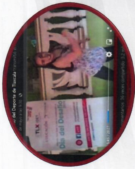
DÍA DEL DESAFÍO 2020