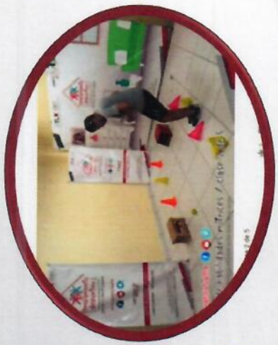
CAMPAMENTO DEPORTIVO VIRTUAL IDET 2020

Derivado de los acontecimientos vividos actualmente a consecuencia del COVID 19 y tomando en consideración el POA (programa operativo anual) nos vemos en la necesidad de plantear estrategias para cumplir con el propósito, programas y acciones de manera virtual