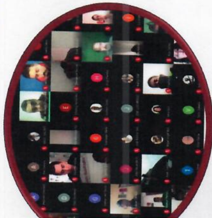
SEGUNDA REUNIÓN CON DIMCUFIDES