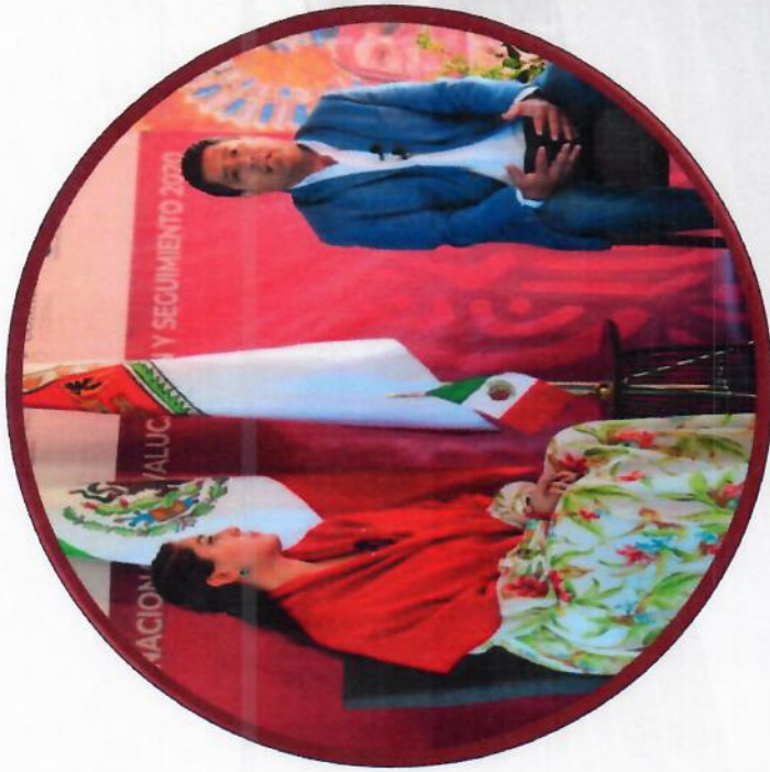
Reunión técnica nacional de seguimiento y evaluación CEDEM-CONADE