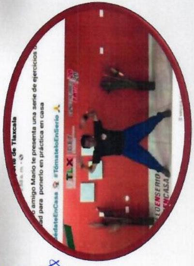
Actívate en casa