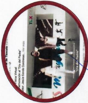
DÍA DEL PADRE